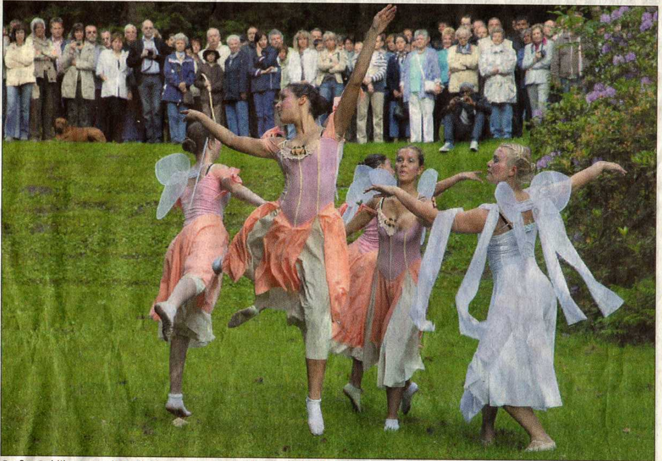
Großes Publikum zog die Ballett- und Tanzakademie am frühen Morgen mit ihrem Elftanz am Ballotsbrunnen an.

Der Bär tobte unterdessen am Forsthaus Löhen, das von vielen Hundert Wanderern bevölkert wurde. Die Dixieland-Band „Seven Street Synopators“ hatten hier ihre Bühne aufgestellt, zogen aber mitunter auch als Marching Band mit Susaphon, Wasch-