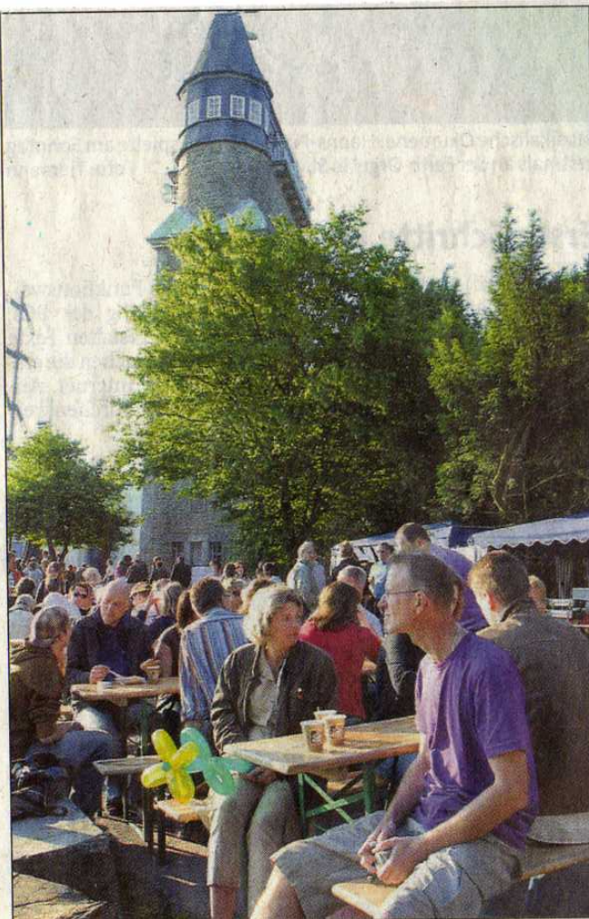
Nach sieben Jahren gehörte der Danzturm mit einem echten Jazz-Frühschoppen wieder zu den Ausflugszielen.