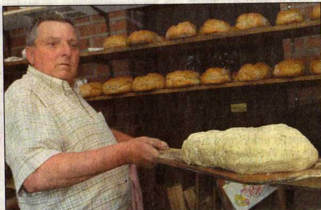
Ein Blick in die Kesbener Backstube, wo schon am frühen Morgen die Spezialität des Dorfes für die Besucher zubereitet wurde.

■ Eine Fotostrecke mit weiteren Impressionen des Iserlohner Pfingstmontags ist unter www.ikz-online.de zu finden.